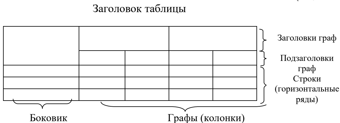
Рис. 1. Структура и вид таблицы

При переносе части таблицы на другую страницу слово «Таблица» и ее номер и заголовок указывают один раз над первой частью таблицы; над другими частями ставят слова «Продолжение табл.» и ее номер или «Окончание табл.» и ее номер.